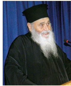
Ὁ π. Γερβάσιος

Ὁ π. Γερβάσιος ἀναφερόμενος σ' ἐκεῖνα τά χρόνια τῆς νιότης του στό Σι-