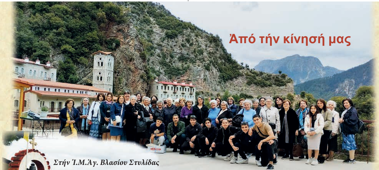
Στήν Ἱ.Μ.Ἀγ. Βλασίου Στυλίδας