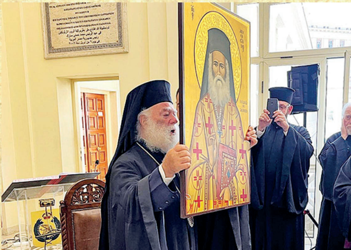
Ο Μακαριώτατος Πατριάρχης Αλεξανδρείας κ. Θεόδωρος κατά τήν άγιοκατάταξη τοῦ π. Χρυσόστομου Παπασαραντόπουλου.

Ο Εύαρεστος Μουσουργάκι, παρόλο πού τοῦ προτάθηκε, ἀρνήθηκε νά χειροτονηθεί λέγοντας: «Αν γίνω ιερέας, θά περιοριστώ σέ μιά ένορία. Έγώ