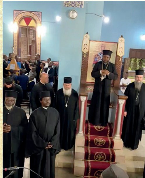
Ὁ Σεβασμιώτατος Μητροπολίτης Κανάνγκας κ. Χαρίτων.

2022, πού ἔγινε ἡ ἐκλογή τοῦ Χαρίτωνος, μέχρι τίς 19 Ἰανουαρίου, (ἐορτή τῶν Θεοφανείων μέ τό παλιό ἡμερο-