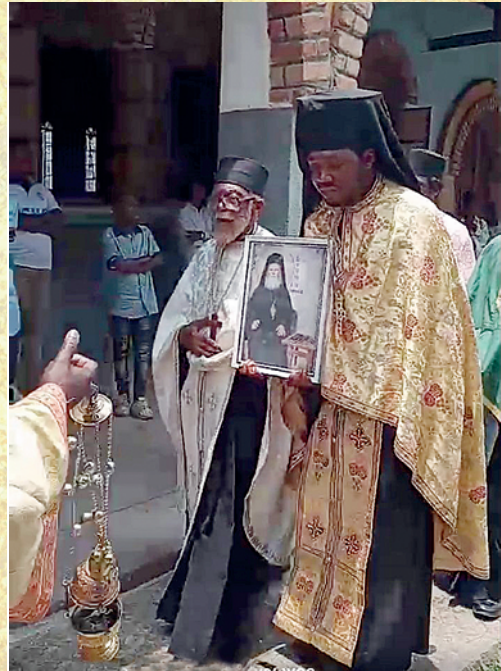
Οί πιστοί στην Κανάνγκα δέν ξεχνούν τόν Άγιο πού τούς οδήγησε στην Όρθοδοξία.

Στίς 12 Ίουνίου 1972 ό Ευάρεστος Μουσουργάκι μέ τόν συνιδρυτή τής «έκκλησίας» του στέλνουν μιά επιστολή στόν άρχηγό τής Έκκλησίας αυτής «μέ τά μαύρα ράσα» -πού ήταν τότε ό Μητροπολίτης Κε-